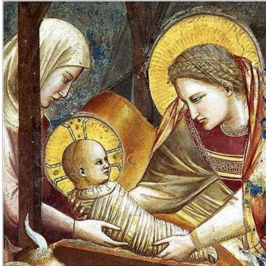
Natività di Giotto

“ Rallegratevi, ve lo ripeto, rallegratevi poiché il Signore è vicino”. Lui bussa alla porta, ci è vicino e così è vicina la vera gioia, che è più forte di tutte le tristezze del mondo, della nostra vita.... Si è fatto carne con la nostra carne, sangue del nostro sangue. E' uomo come noi e abbraccia tutto l'essere umano.